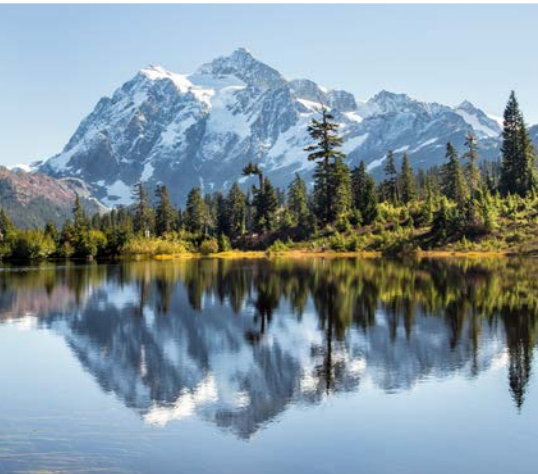
42 nd Picture Lake with Mt. Shuksan – Glacier