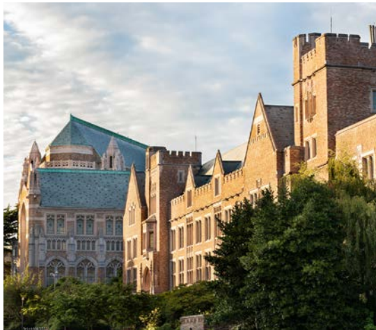
43 rd University of Washington – Seattle