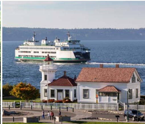
21 st Mukilteo Lighthouse Park and Ferry Terminal – Mukilteo