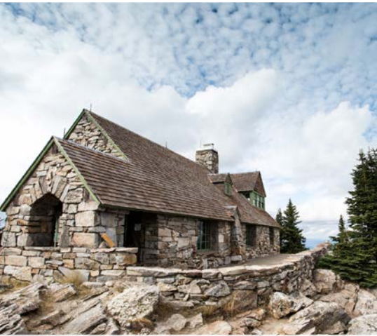
4 th Vista House – Mount Spokane State Park