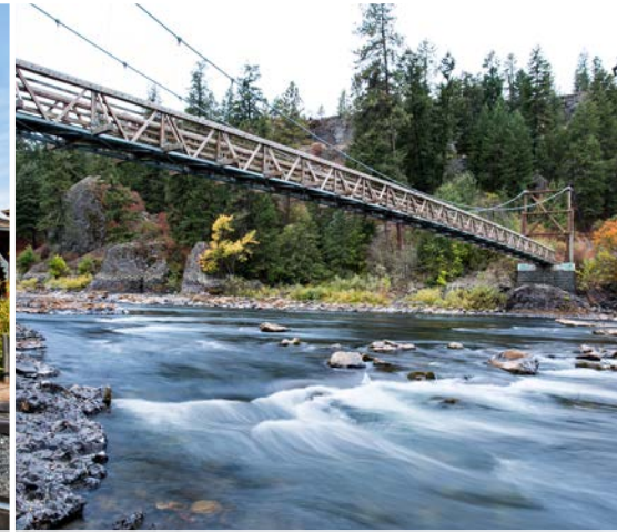
6 th Riverside State Park Bowl & Pitcher Area – Spokane