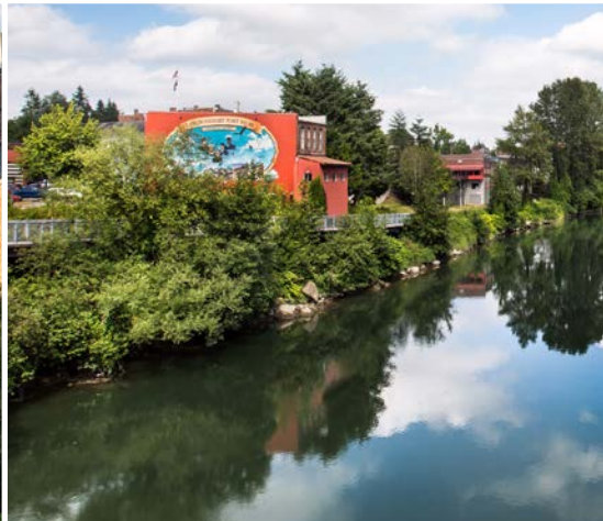
44 th Snohomish River – Snohomish