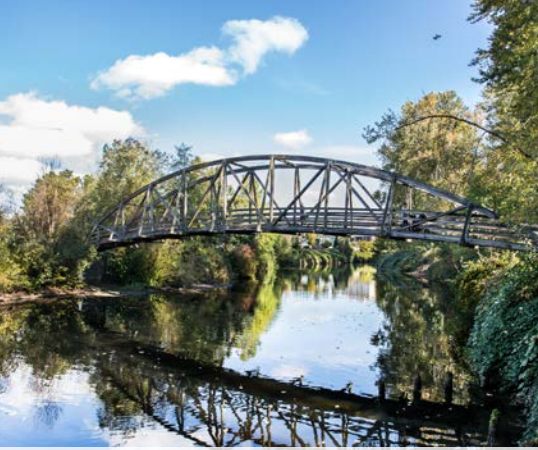
1 st Sammamish River Trail – Bothell Landing