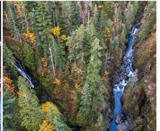
35 th High Steel Bridge – South Fork Skokomish River