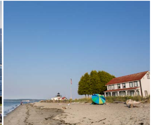
23 rd Point No Point County Park and Lighthouse – Hansville