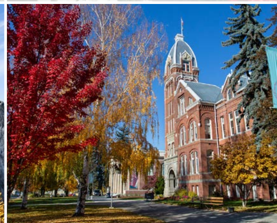
13 th Central Washington University – Ellensburg