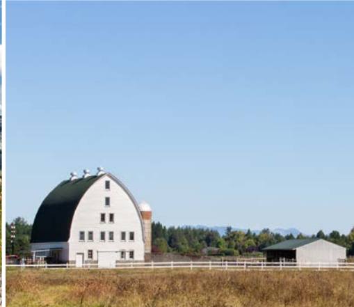
18 th Farm with Mount St. Helens – Brush Prairie