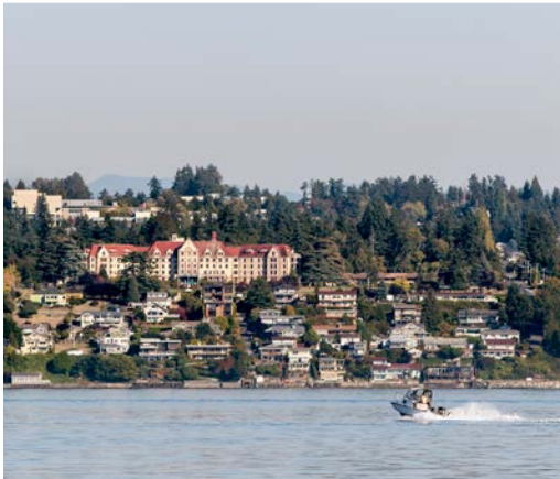
33 rd Des Moines