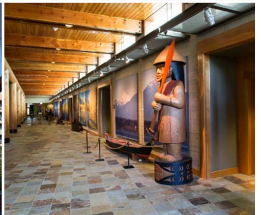
38 th Hibulb Cultural Center – Tulalip