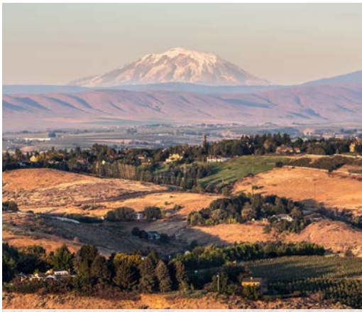
14 th West Valley with Mt. Adams – Yakima