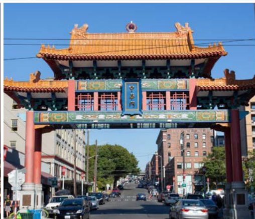
37 th Historic Chinatown Gate, International District – Seattle