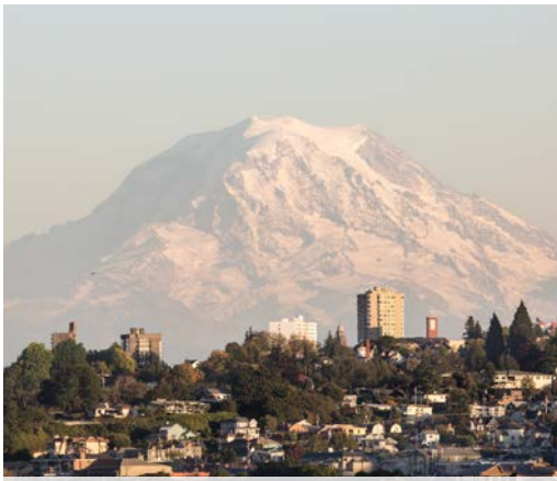
27 th Ruston Way view of Mt. Rainier – Tacoma