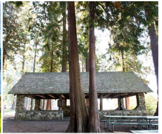
29 th Wapato Park – Tacoma