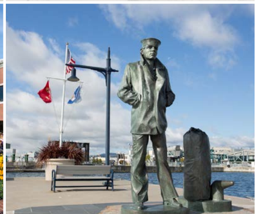
26 th Boardwalk – Bremerton