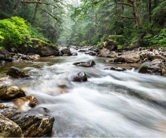
39 th North Fork Sauk Creek – Darrington