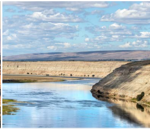
15 th White Bluffs along the Columbia River – Hanford Reach National Monument