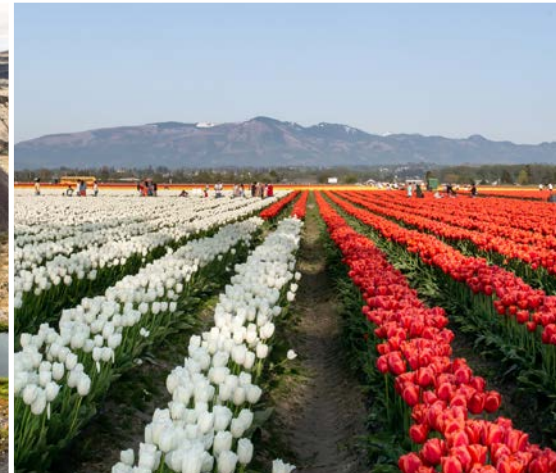
10 th Roozengaarde Tulip Farm – Mount Vernon