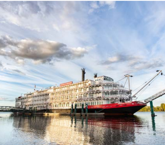
8 th Howard Amon Park – Richland