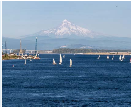
49 th Columbia River with Mt. Hood – Vancouver