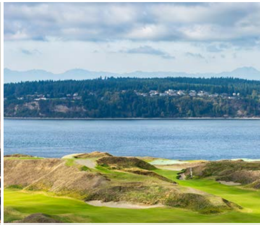
28 th Chambers Bay – University Place