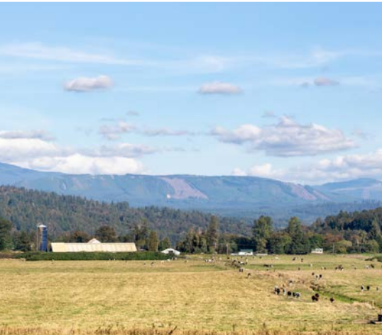
45 th Snoqualmie River Valley – Duvall