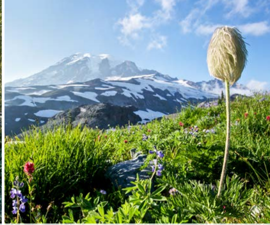
2 nd Paradise Glacier Trail – Mount Rainier