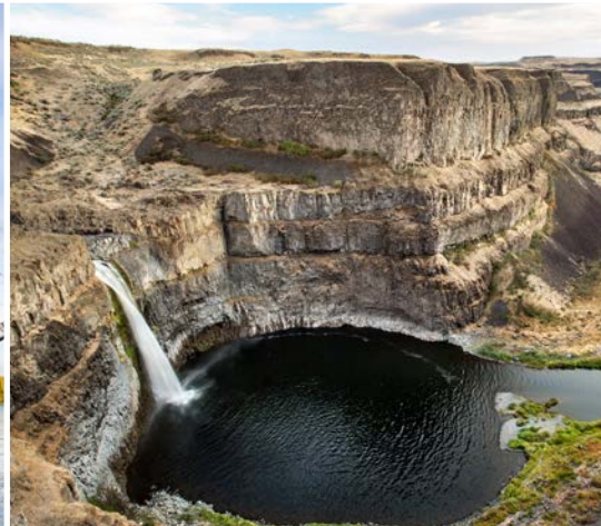
9 th Palouse Falls State Park – LaCrosse