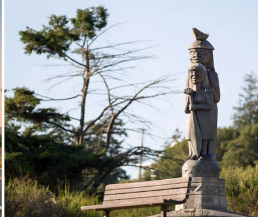
32 nd Richmond Beach Saltwater Park – Shoreline