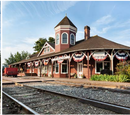
5 th Railroad Community Park – Snoqualmie