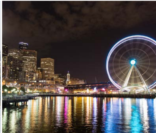
34 th Pier 57, Elliot Bay – Seattle