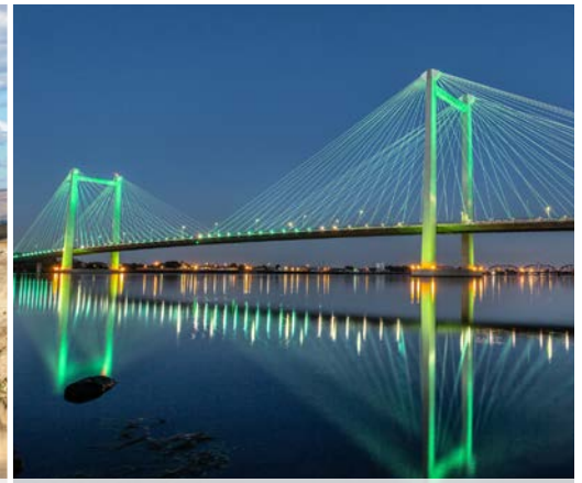
16 th Ed Hendler Bridge – Tri-Cities