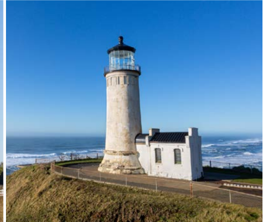
19 th Cape Disappointment State Park – Ilwaco