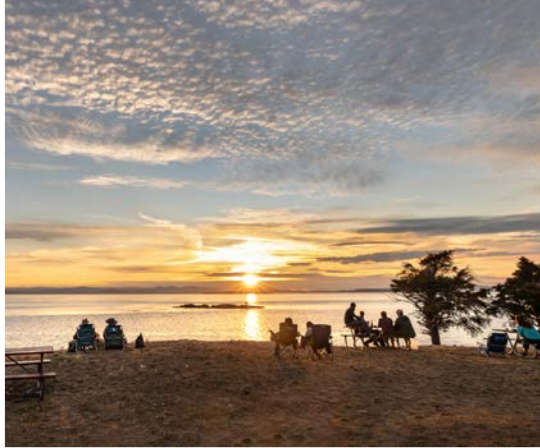
40 th San Juan County Park – San Juan Island