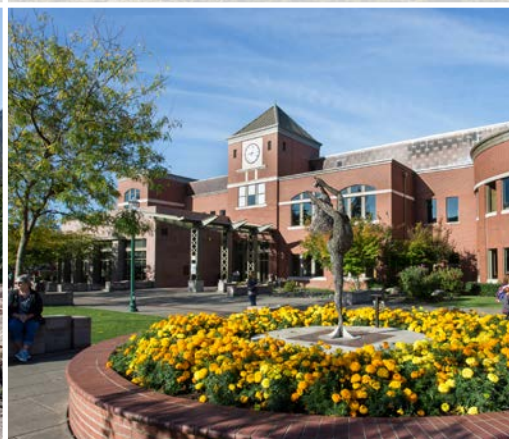
25 th Pioneer Park and Library – Puyallup