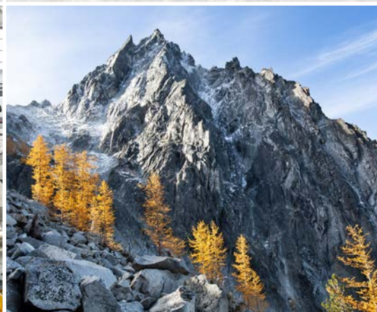
12 th Asgard Pass, Enchantments – Leavenworth