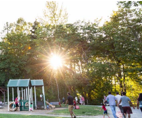
48 th Idylwood Park – Redmond