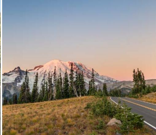
31 st Sunrise Park Rd – Mt. Rainier National Park