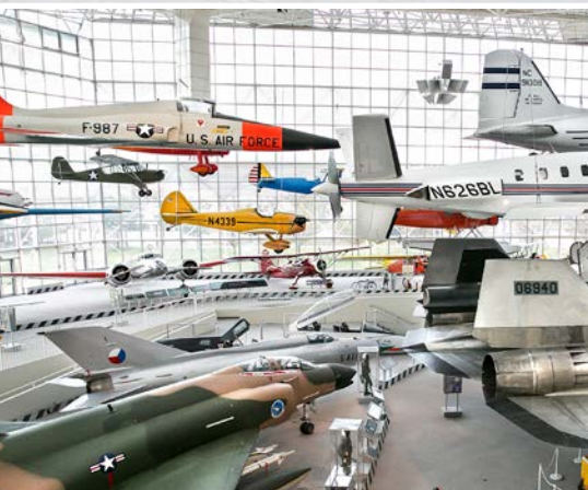
11 th The Museum of Flight – Seattle