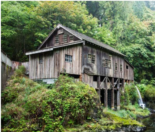
20 th Cedar Creek Grist Mill – Woodland