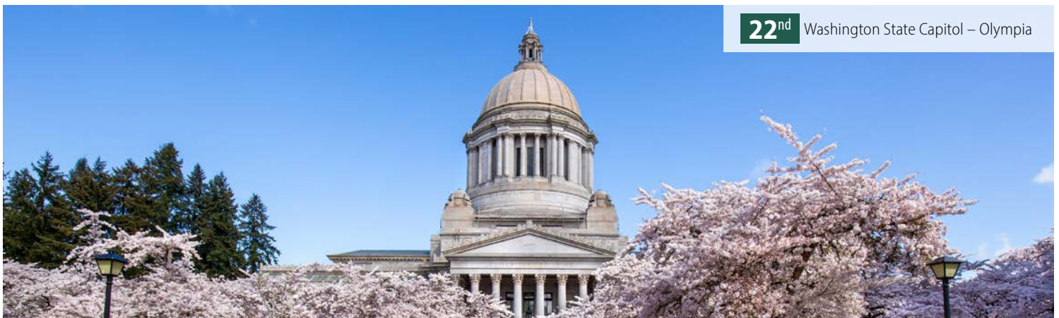
22 nd Washington State Capitol – Olympia

El Vicegobernador sirve por tradición como Presidente del Comité de Reglas del Senado. El vicegobernador es miembro del Comité de Finanzas del Estado, el Comité del Capitolio del Estado, la Autoridad de Instalaciones de Atención Médica de Washington, la Autoridad de Instalaciones de Educación Superior de Washington y el Comité de la Medalla al Mérito del Estado.