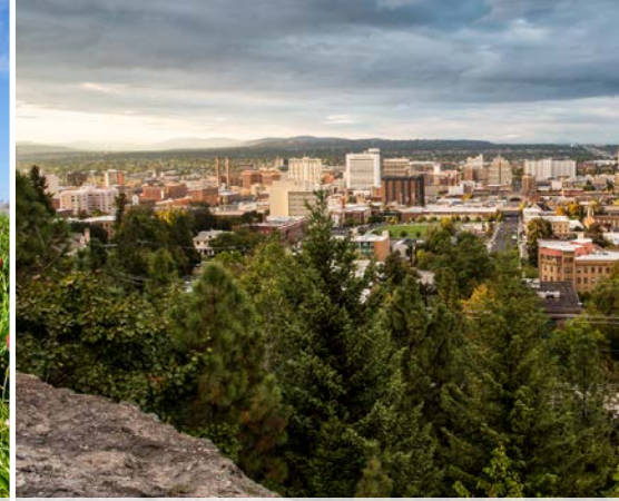
3 rd Cliff Drive Overlook – Spokane