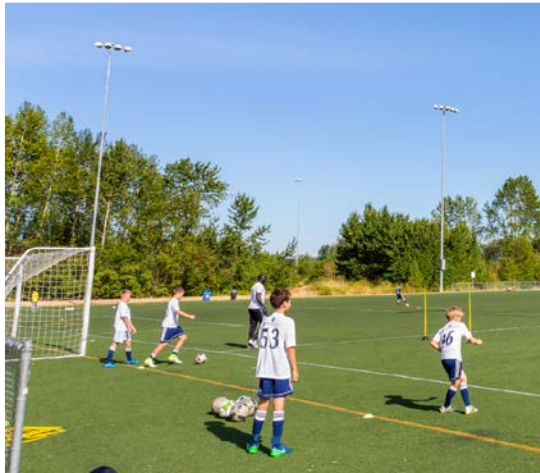
46 th Magnuson Park – Seattle