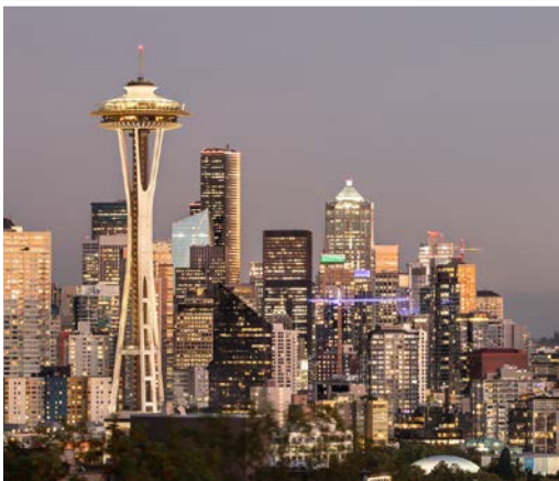
36 th Space Needle – Seattle