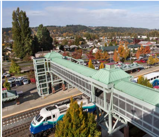
47 th Auburn Station – Auburn