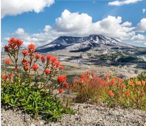
17 th St. Helens from Johnston Ridge – Toutle