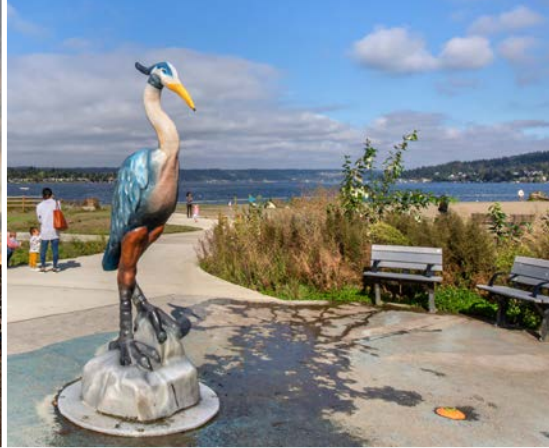
41 st Lake Sammamish State Park – Issaquah