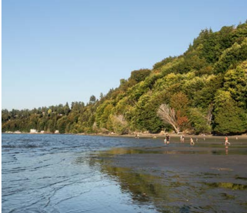
30 th Dash Point State Park – Federal Way