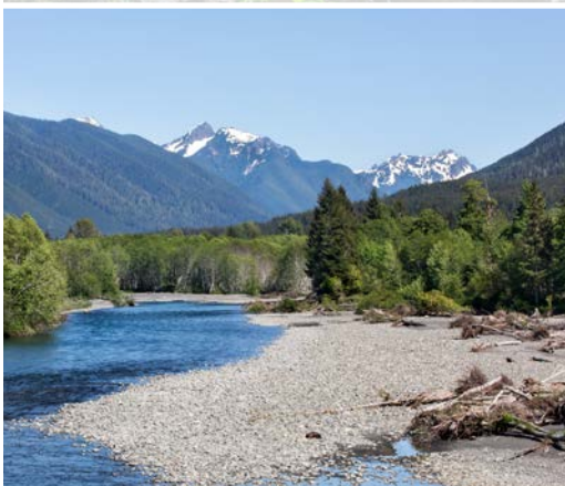
24 th Hoh River – Olympic Peninsula